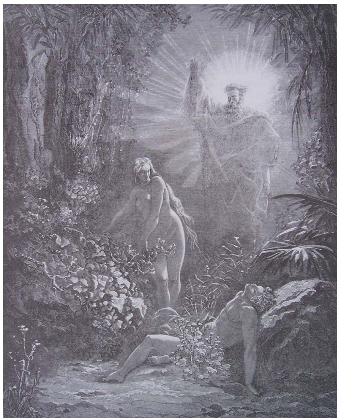
Gravure de Gustave Doré

« Dieu créa l'homme à son image », que veut dire cette phrase ? Elle veut simplement et symboliquement exprimer ce qui a été dit plus haut ! Dieu est lumière, pure conscience. Ainsi, étant créés à « son image », nous ne sommes pas différent du Père divin à la base. J'insiste sur ce fait ésotérique certes, mais important pour la compréhension de ce cours. La Bible nous dit ensuite : « il le créa à l'image de Dieu : il les créa mâle et femelle ». Voilà qui est capital ! L'homme primordial du livre de la Genèse n'est pas le sexe masculin tel que nous le pensons trop souvent. Ce n'est pas le corps physique masculin équipé du fameux phallus ( dont S.Freud aura su nous en dire tellement de choses, bonnes et mauvaises d'ailleurs ).